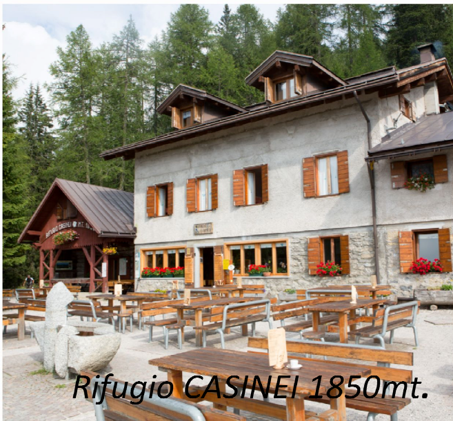
Rifugio CASINEI 1850mt.