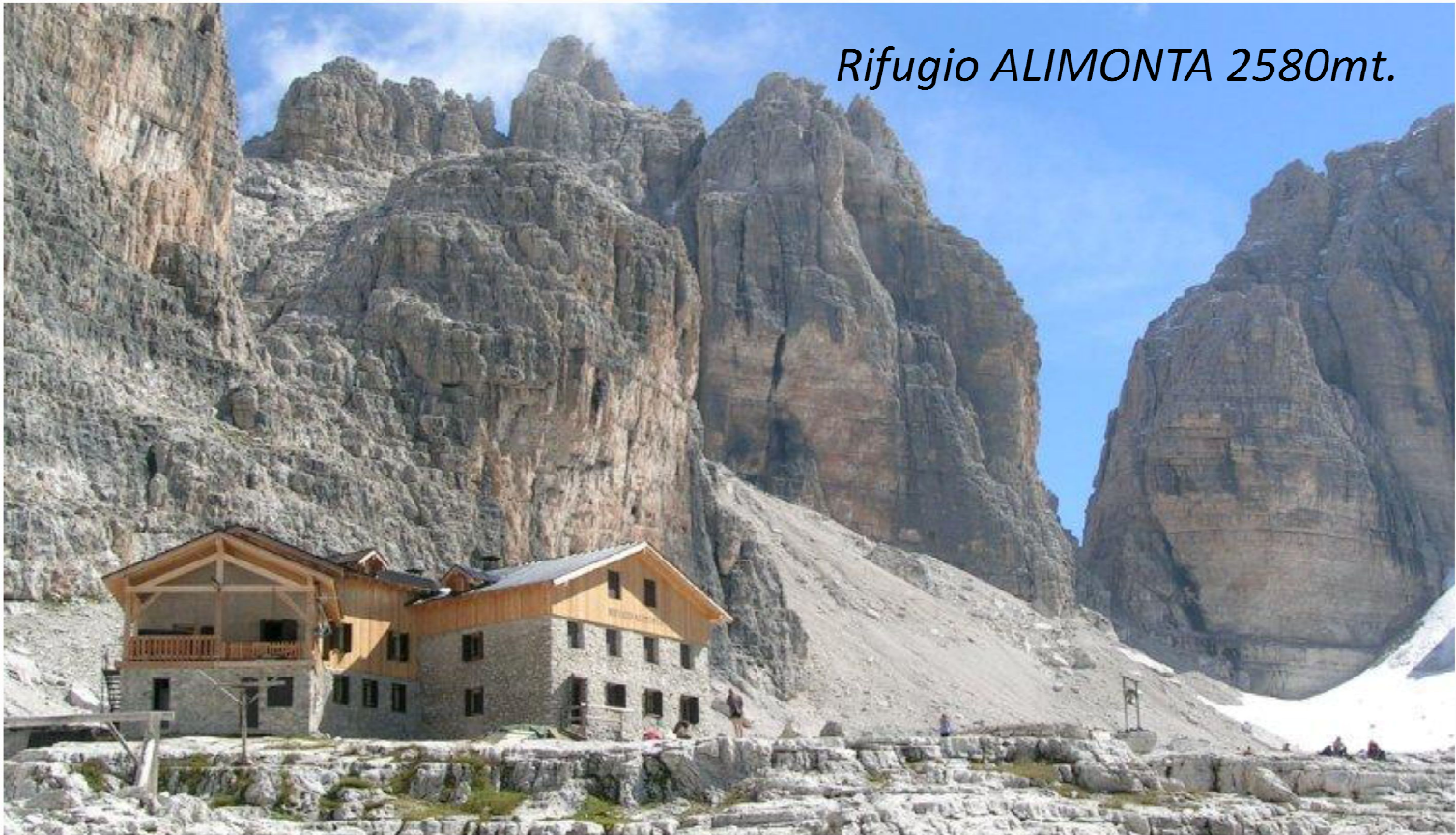
Rifugio ALIMONTA 2580mt.