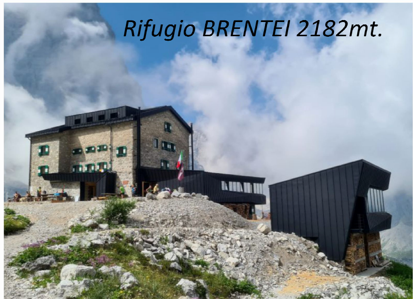
Rifugio BRENTEI 2182mt.