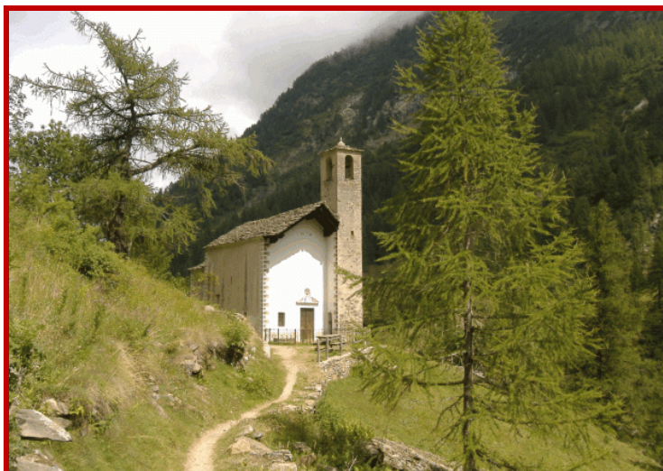
Oratorio di San Grato alla Peccia 1529mt.