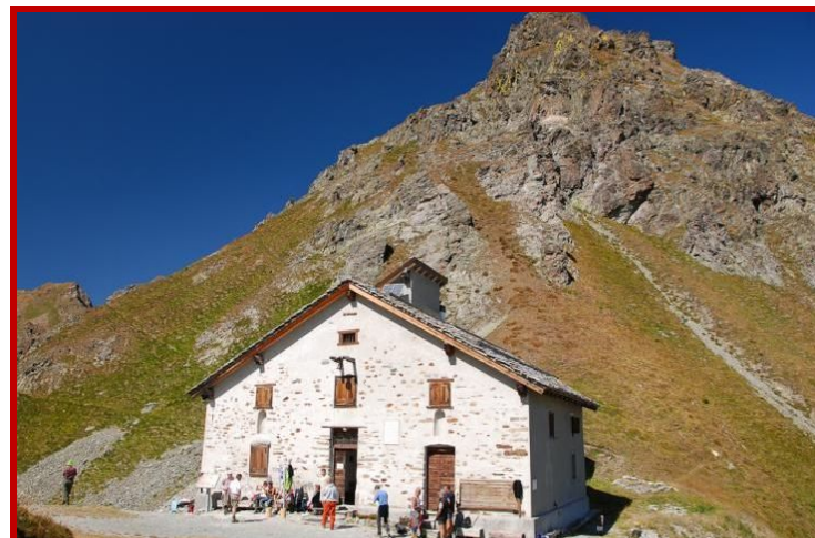
Rifugio Ospizio Nicolao Sottile 2480mt.