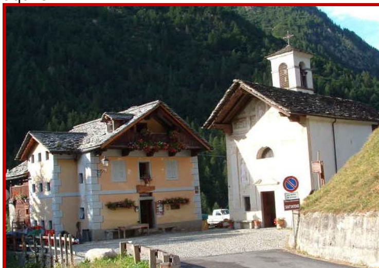
Rifugio Val Vogna 1381mt.

E' una tappa della Grande Traversata delle Alpi (gta) un itinerario che unisce tutto l'arco alpino nella Regione Piemonte. Il Rifugio Ospizio N.Sottile si trova al Colle Valdobbia, valico al confine tra la Val Vogna in Valsesia e la Valle del Lys (Gressoney) in Valle D'Aosta. Per il colle transitava l'antica via Regia, importante e frequentata strada di collegamento e per questo motivo nel 1787 fu costruita una cappella con piccolo ricovero che venne ampliato nel 1823 dal canonico Nicolao Sottile. La salita dal lato valesiano si effettua su una comoda mulattiera e l'unica difficoltà è data dalla lunghezza del percorso. Per gli escursionisti meno allenati il giro ad anello delle frazioni Walser nella parte bassa del vallone o la stupenda piana dell'Alpe Larecchio 1895mt. possono costituire più brevi ma ugualmente appaganti itinerari a sè stanti. Il rifugio è meta di notevole interesse naturalistico per l'ambiente incontaminato e selvaggio dove è possibile incontrare stambecchi, camosci, marmotte e aquile.