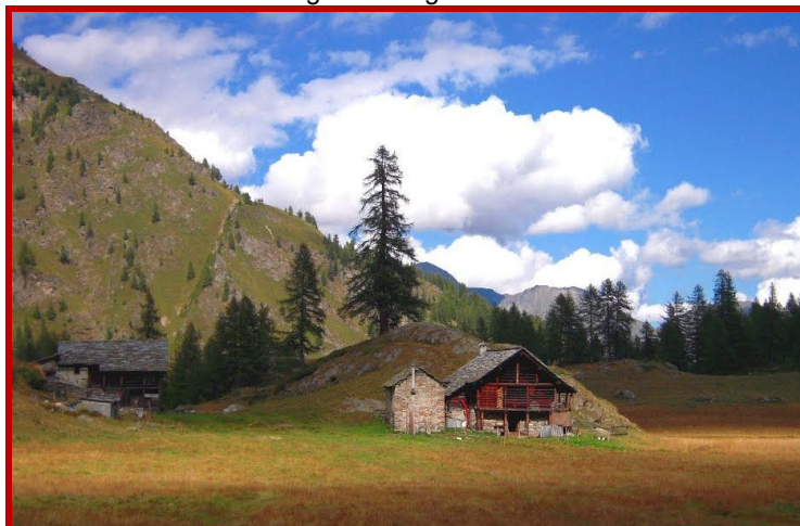
Alpe Larecchio 1895mt.